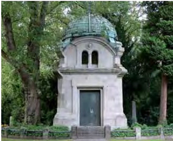
RESTAURIERTES MAUSOLEUM RÜHLING, ABTEILUNG 10, HEUTE FÜR URNENBESTATTUNGEN GENUTZT

Die durch Trip begonnene, von Kube maßgeblich fortgeführte und durch Wernicke abgeschlossene gärtnerische Anlage der Abteilungssinnenflächen vervollkommnete den Friedhof bis 1936 zu einem Gesamtkunstwerk. Dies war der Höhepunkt der gestalterischen Entwicklung des Stadtfriedhofes Engesohde. Die durch Jacobi veranlassten Strukturveränderungen hatten einzig pflanzechnische Hintergründe und verfolgten kein neues Anlagenkonzept. Doch folgte die Erweiterung der neuen Urnenabteilungen einer Planungs idee in den charakteristischen Formvorstellungen der frühen 60er Jahre.