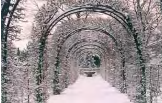
HECKENBÖGEN IM WINTER, ABTEILUNG 39

Die Innenraumgestaltung der Abteilungen wurde ab 1908 durch Stadtgartendirektor Zeininger (1908-1911) und anschließend vom Stadtgartenamtmann Schulz und Stadtgartendirektor Kube (1913-1934) fortgeführt. Es entstanden Anlagen regelmäßigen Stils, mit axial- oder diagonalsymmetrischen Teilbereichen sowie Schmuckplätzen, die den Tendenzen der Gartenkunst des frühen zwanzigsten Jahrhunderts in Deutschland entsprachen. Erstmals spielten Heckenpflanzungen als Raumbegrenzungen eine größere Rolle: knie- bis halbhohe Hainbuchen- und Taxushecken sowie von Heckenbögen überspannte Wege. An den Endpunkten, insbesondere der Längsachsen, wurden herausragende Familiengrabstätten als Blickpunkte errichtet. In vielen zeitgenössischen Fachzeitschriften wird die herausragende Bedeutung des Engesohder Friedhofes in seiner Gestaltung als „Heckenfriedhof“ herausgestellt.