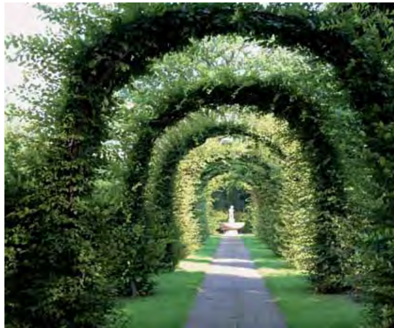
HECKEN ALS RAUMGESTALTUNG, ABTEILUNG 27

Durch Stadtgartendirektor Wernicke (1934-1948) wurde das Werk Kubes mit der Innenraumgestaltung für Abteilung 39 zum Abschluss gebracht. Die im Jahre 1939 von der Stadt Hannover erlassene Friedhofsordnung schrieb die Einhaltung vorgegebener Grabmaltypen verbindlich vor, wodurch die seit dem Ersten Weltkrieg wirksamen Bestrebungen, Friedhöfe als künstlerische Gesamtanlage zu gestalten und zu erhalten, fortwirkten.