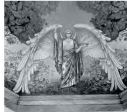
DECKENGEMÄLDE IM MAUSOLEUM VON CÖLLN

und kulturgeschichtlichen Wertes der historischen Anlage des Stadtfriedhofes Engesohde zunächst in Fachkreisen, aber auch bei den Friedhofsbesuchern.