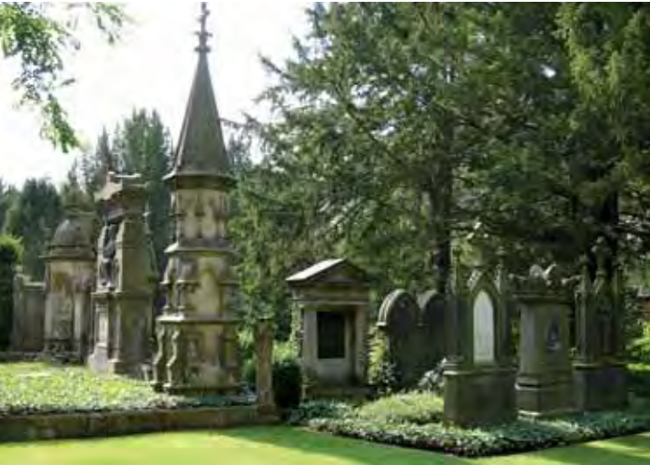
HISTORISCHE GRABSTÄTTEN, ABTEILUNG 2

„... mehr als tausend Familien-Grabstätten sind an den Hauptwegen mit Sorgfalt und Liebe hergestellt, und die meisten derselben sind künstlerisch mehr oder weniger reich ausgestattet. Da findet man Denkmäler aller Art und reichster Abwechslung aus Sandstein, Marmor oder Granit, insbesondere Kreuze, Stelen, Obelisken, Denksäulen mit Urnen oder Figuren, Gedenktafeln, Sarkophage und auch eine Anzahl von Gruftgebäuden. Die einzelnen Plätze sind mit Gittern umschlossen, welche meist aus Schmiedeeisen hergestellt, in den verschiedenartigsten Formen zum Teil sehr kunstvoll und schön ausgeführt sind.“