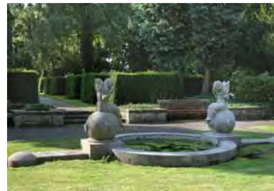
INNENRAUM, ABTEILUNG 16

Ab 1902 wurden die Reihengrabfelder innerhalb der Abteilungen in großzügig aufgeteilte Anlagen mit Erdbegräbnissen entsprechend dem damaligen Zeitgeschmack umgestaltet. Das betraf während der Amtszeit von Gartendirektor Julius Trip (1897-1907) zunächst die an der Kapelle gelegenen Abteilungen.