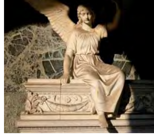
GRABSTÄTTE IN DEN ARKADEN

Der ursprüngliche Friedhof umfasste elf Abteilungen (Nr. 1-11) und wurde zwischen 1872 und 1877 bereits um sechs weitere, vermutlich ebenfalls von Droste geplante Quartiere erweitert (Nr. 12-25). Diese mauerumschlossene Anlage gliedert sich durch ein axiales Wegesystem in dreieck-, trapez- und rechteckförmige Abteilungen.