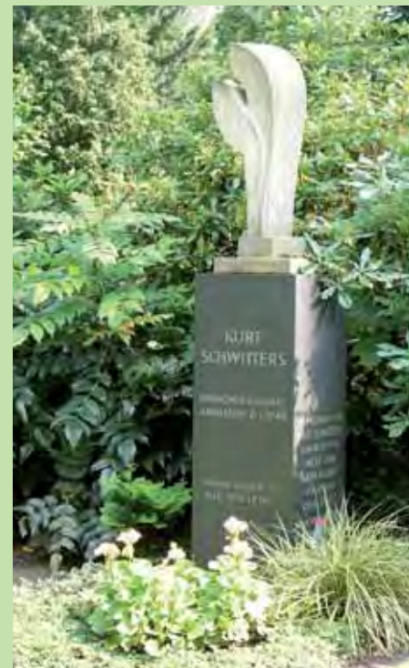
GRABSTÄTTE SCHWITTERS, ABTEILUNG 6